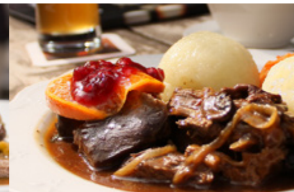
Wild-Menü im Schöffenhäuser