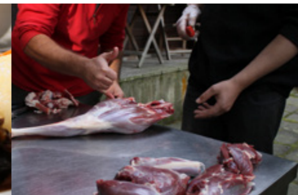
Wildfleisch vom Jäger