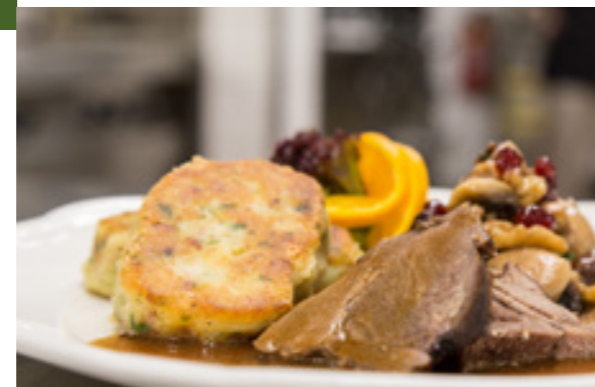
Wild-Menü im Werrapark Resort Hotel Frankenblick

Sa & So 12.30-13 Uhr | anmelden: 036782 61467 Frauenwald | Gasthaus Waldfrieden